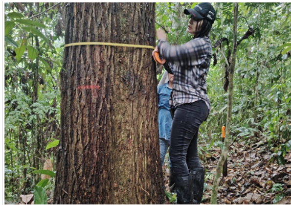
Inspección Técnica Programa de Manejo Forestal