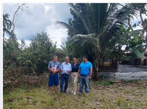
Inspección técnica proyecto de agua potable recinto Mirador