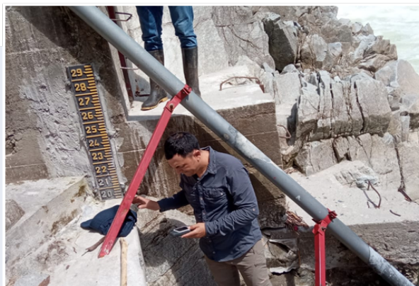
Inspección técnica AUA Hidroeléctrico en la Sofía