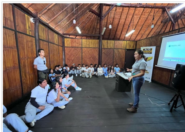
Sensibilización Alto al Tráfico de Vida Silvestre