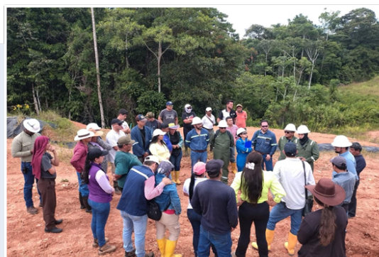
Inspección técnica presunta contaminación