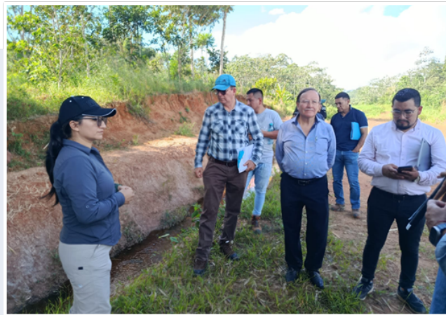
Inspección judicial demanda de contaminación hidrocarburifera